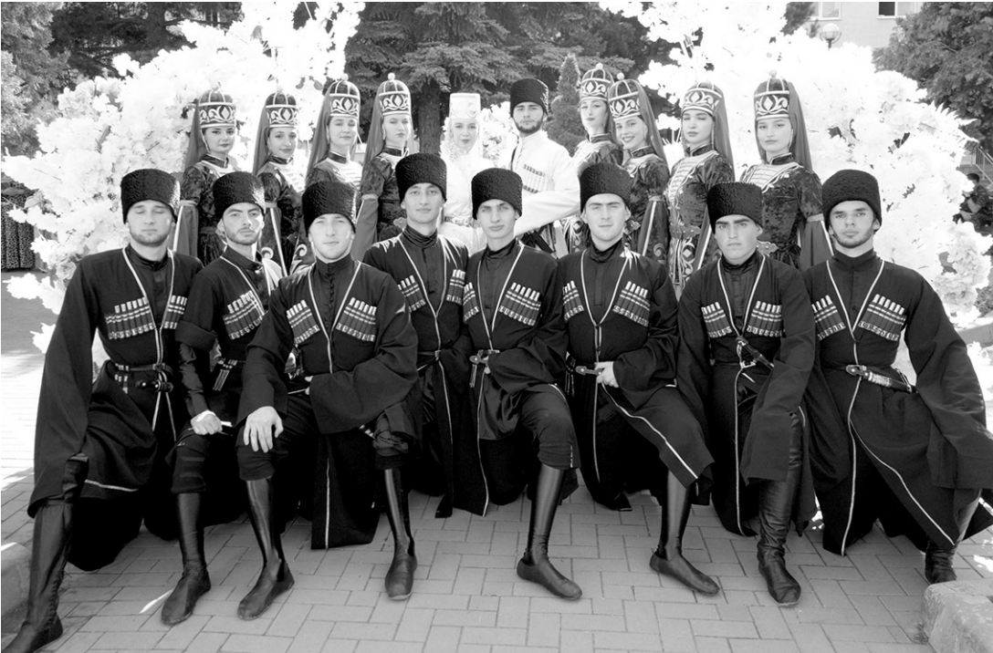
На сцене блистал студенческий народный хореографический ансамбль «Шохлук-Дружба»