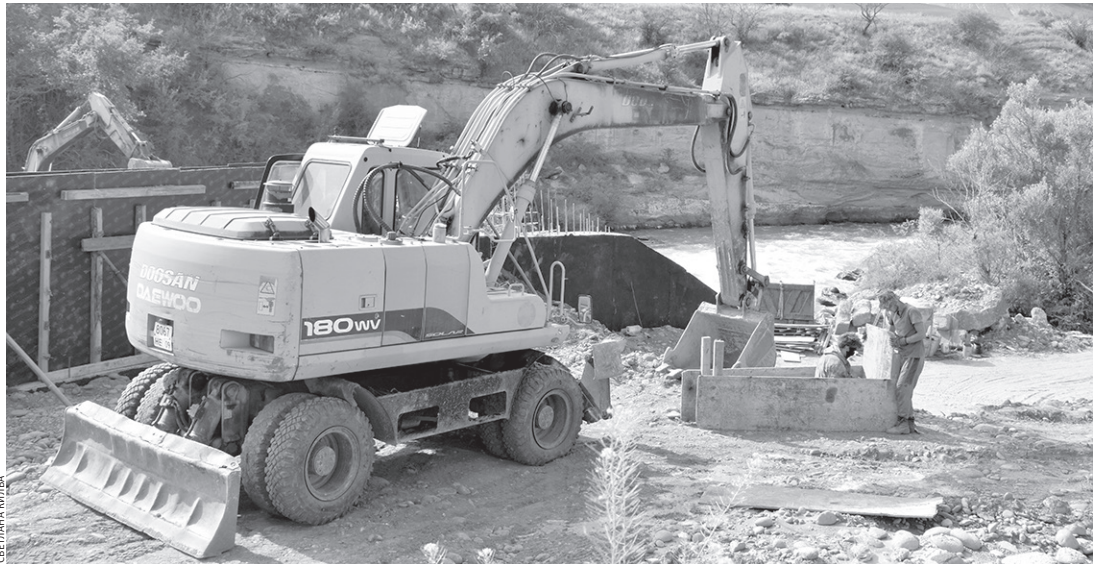
Подрядчики работают без устали