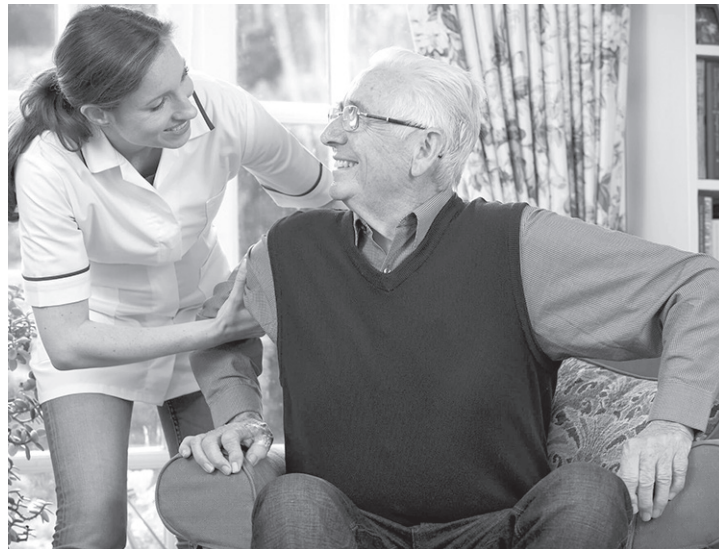
Людям старше 80 лет установлена надбавка к пенсии на уход, при этом обращаться в соцфонд не требуется

С этого года ухаживающего оформлять больше не требуется. Компенсационные выплаты осуществляться не будут. Теперь выплата автоматически устанавливается Отделением Социального фонда России по Карачаево-Черкесской Респу-